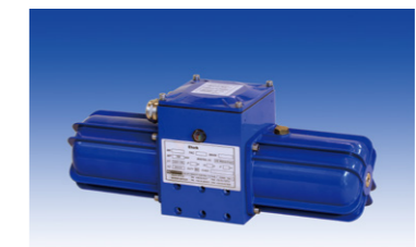
MHPP(ミニ油圧パワーパック)