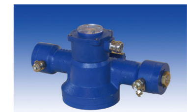
アクチュエーター・インタンク用